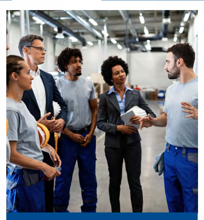
问: 在前几天的一次部门会议上, 主管 当着全组同事的面呵斥我。我应该向谁举 报此种骚扰行为?