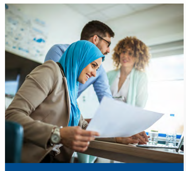
问: 我接到某财经记者的电话,她表示了解到我们将收购 Widget 公司。我是否可以私下告知对方此事不属实?

作为一家跨国公司,统一口径至关重要。因此,只有 Dover 内部指定发言人才能向公众发表某些言论。如需有关如何处理媒体问询的协助,或者如果有媒体成员与您接触,请先联系您运营公司的发言人或 Dover 通信部。如果您收到来自分析师、投资者或潜在投资者的信息请求,请将此请求转给 Dover投资者关系部。在未获授权的情况下,您绝不能试图代表 Dover 发言。